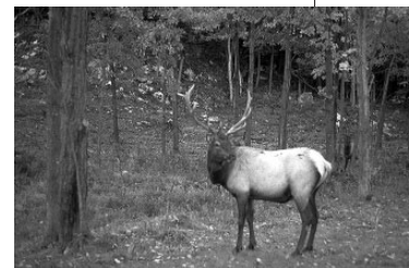
Eland in Canada

4.1 diersoorten In een zo groot werelddeel (Amerika is in grootte het derde werelddeel, na Azië en Afrika) zijn verschillende klimaten te vinden. In deze klimaten leven verschillende diersoorten. Zo zie je in het noorden elanden en oerzons (boomstekelvarkens), in het midden bisons en lynxen en in het zuiden stinkdieren en bisamzwijnen.