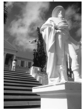
Standbeeld van Columbus in Nassau, op de Bahama's

Er is ook een naam voor Noord-, Midden- en Zuid-Amerika samen: "De Nieuwe Wereld". Deze naam kreeg het continent omdat zoveel Europeanen verhuisden naar het nieuw ontdekte werelddeel om daar een nieuw leven te beginnen. In Europa was het volgens velen te vol geworden, en er was weinig werk te vinden. Noord-Amerika bestaat uit Canada, de Verenigde Staten, Alaska en Groenland.