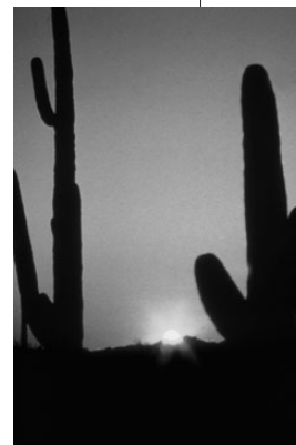
Zonsondergang op de prairie in het zuiden

3.1 van noord naar zuid Als je van het noorden naar het zuiden reist, zie je in Noord-Amerika toendra's, waar veel mos groeit, naaldwouden, grasvlakten (prairies), loofwouden, steppen en tropische regenwouden. Een zeer groot gedeelte van Noord-Amerika is bedekt met bossen. In de noordelijke streken zijn dat naaldwouden, naar het midden toe worden het gemengde bossen (loof- en naaldbomen).