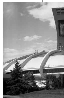
Olympisch stadion in Montreal (Canada)