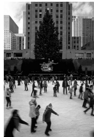
Schaatsen in New York op de ijsbaan van het Central Park

7.2 1865 Na de afschaffing van de slavernij in 1865 waren de slaven vrij, maar gediscrimineerd werden de zwarte mensen nog steeds. Ook in onze tijd krijgen deze mensen in Noord-Amerika vaak minder makkelijk een baan of een huis dan blanken. Toch hebben zij volgens de wet gelijke rechten!