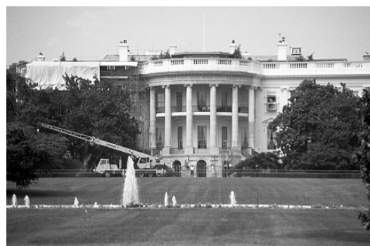
Het Witte Huis in Washington

5.4 godsdienst Veel mensen vertrokken naar Amerika omdat ze daar niet vervolgd werden vanwege hun godsdienst. Zo zijn in Noord-Amerika wel 250 verschillende kerkgenootschappen (groepen gelovigen) te vinden.